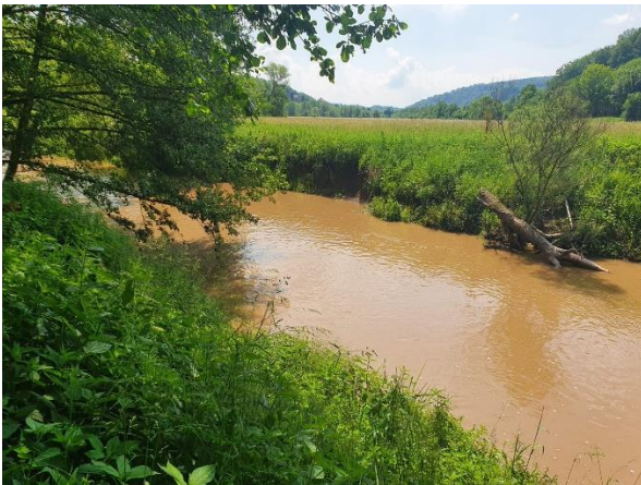
Abb. 1: Gewässer nach Bodenerosion

Bei sehr hängigen Flächen mit 12% Gefälle beträgt der jährliche mittlere Bodenabtrag in Maisfruchtfolgen etwa 7 t/ha 1 . Dadurch geht langfristig wertvolles Ackerland verloren. Auch aus Sicht des Umweltschutzes ist dies problematisch, weil Erosion auf Flächen mit angrenzenden Gräben und Gewässern ein wesentlicher Faktor für die Eutrophierung der Gewässer bis hin zum Meer ist.