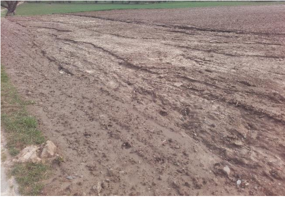
Abb. 2: Erosion im Vorgewende. Der Bereich, der quer zum Hang bestellt wurde, ist von Erosion verschont geblieben.

Die Aussa at orientiert sich am Saattermin des Mais: Ist das Ziel auch im Schutzstreifen Mais zu ernten, wird erst Mais gelegt, der nächsten Regen abgewartet und dann der Schutzstreifen angelegt, um dem Mais etwas Vorsprung zu verschaffen. Schutzstreifen müssen unbedingt auch schon im oberen Bereich eines Gefälles angelegt werden, um das Zusammenfließen kleiner Erosionsrinnen zu größeren Rinnen zu verhindern (Abb. 3).