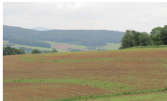
Abb. 3: Erosionsschutzstreifen in Mais aus Wintergerste. Der erste Streifen im oberen Hangbereich verhindert das Zusammenfließen kleiner Erosionsrinnen bevor sie an Geschwindigkeit gewinnen.

HALM-Maßnahmen können jedoch immer nur bis zum 01.10. für die Folgejahre beantragt werden, sodass die Förderung von Erosionsschutzstreifen für dieses Jahr nicht mehr in Anspruch genommen werden kann.